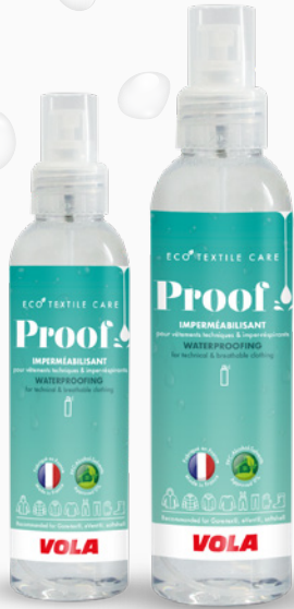
Proof SPRAY L'imperméabilisant The waterproofing