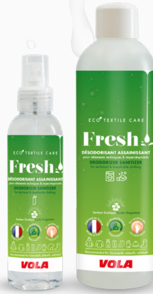
Fresh SPRAY/MACHINE Le désodorisant assainissant The deodorizer sanitizer

de matières premières biodégradables. of biodegradable raw materials.