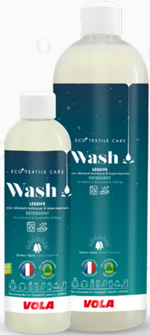
Wash La lessive The detergent