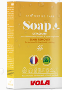
Soap Le détachant The stain remover