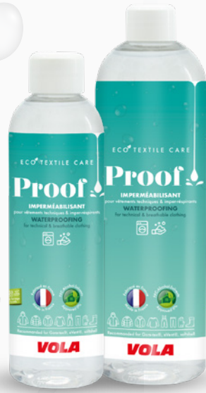
Proof MACHINE L'imperméabilisant The waterproofing